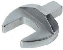
开口扳手头部(选配)