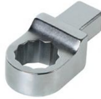
梅花扳手头部(选配)